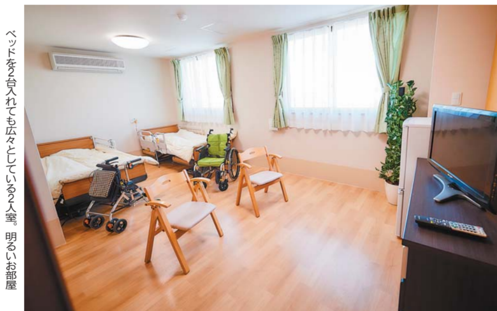
ベッドを台入れても広々としている2人室、明るくお部屋