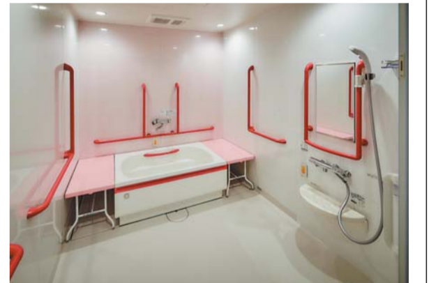
介護用個別浴槽。白内障の方でも見やすいように、手すりはピンク色となっている

「理事長の思いや同会の理念をお聞かせください。」 高比 西の京病院は、昭和61年10月1日に、最新の設備、最高の技術、最新の心の三つで『メビウスの輪』を描き、これを永遠の課題として患者様を診ていくというコンセプトのもとに開設しました。当初の約10年間は医療一筋に続けてきました。