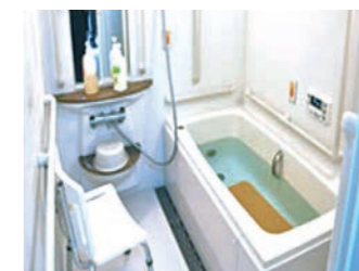
一般浴室(各フロア)