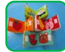
いないいないばあ玩具