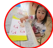
手作りのこいのぼり 作りに夢中です!