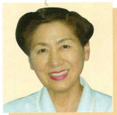
医療法人 康仁会 西の京病院