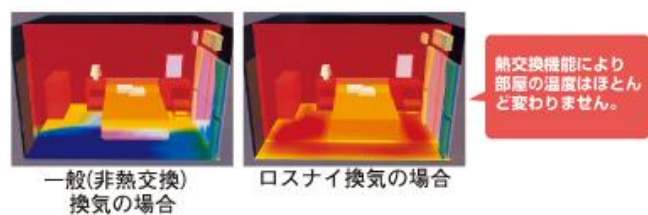
▲ロスナイの熱交換シミュレーション