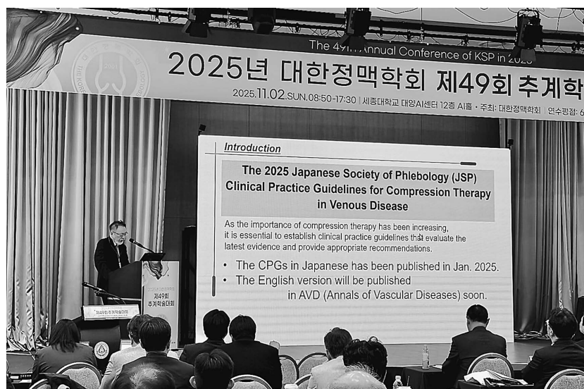
図4 筆者講演の様子