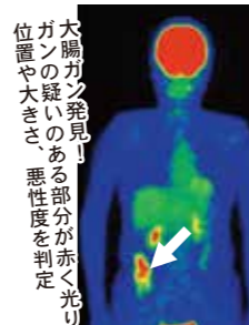
大腸ガン発見! ガンの疑いのある部分が赤く光り、位置や大きさ、悪性を判定

本人の三大死因である「ガン」「虚血性心疾患」「脳卒中」。中でも、3人に1人はガンで亡くなる現在だが、医学の進歩により早期発見・早期治療で治療する時代でもある。奈良県一の実績を持つPET検査と、苦痛のない内視鏡検査を誇る西の京病院では、今春からPETがん総合健診と人間ドックが受診できる総合健診センターをオープン。隣接するメディカルプラザ薬師西の京内の健診専用フロアで、長寿時代の健康管理に邁進する。 「早期」とは、自覚症状が出てからのことではない! 平成16年のPET導入から5万8千件以上の実績!