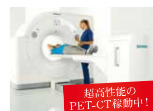
超高性能のPET-CT稼動中!

PET-CTは、組織やガンの活動状態(良性か悪性か、再発か否か)の情報を診断する「PET検査」と組織やガンの細やかな形態や位置(ガンの形や大きさ、どの臓器のどの位置にあるのか)を検出する「CT検査」を同時に行える検査機。